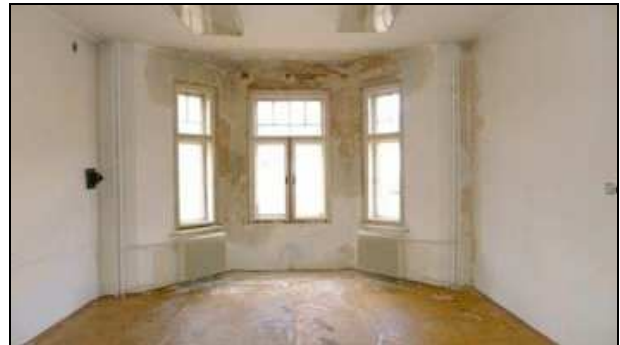
1. NP (patrné zatékání balkonem)