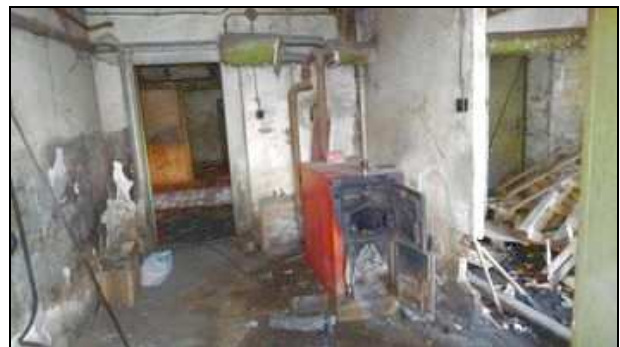
Sklep - kotelna