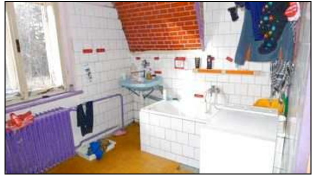
2. NP – koupelna