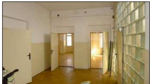
1. NP - hala