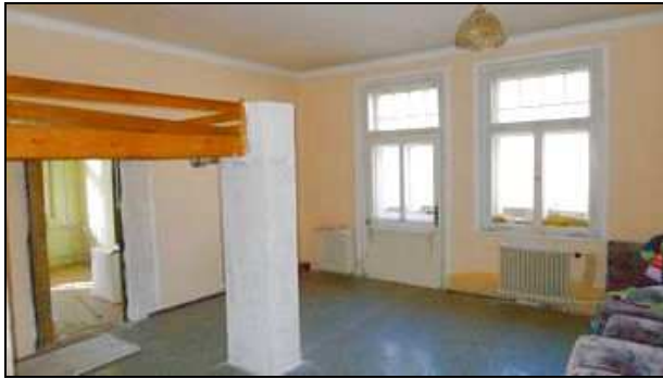
2. NP - pokoj