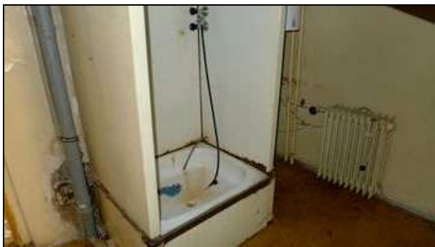
1. NP - umývárna