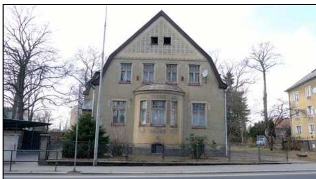
pohled z ulice - východní - hlavní průčelí