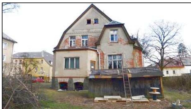
pohled zadní ze zahrady – západní