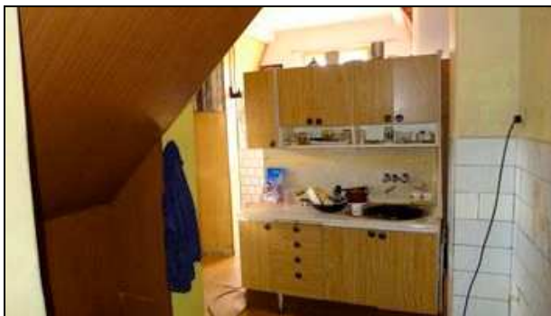
2. NP - kuch. kout