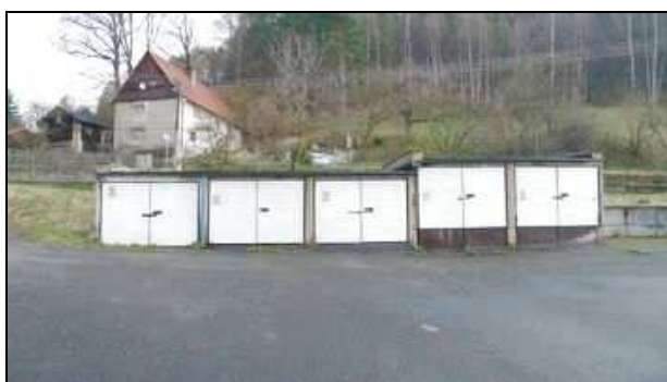
řadové betonové garáže na pč. 806/24