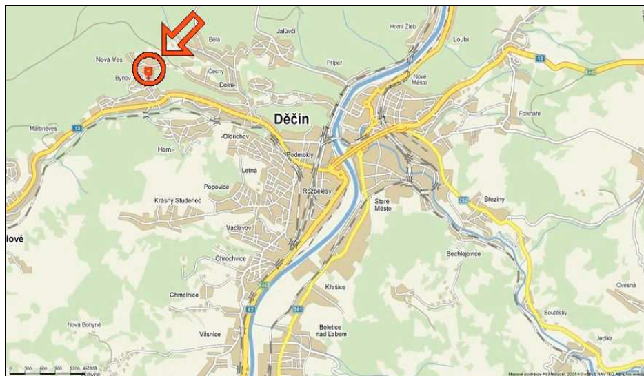
celková situace na mapě