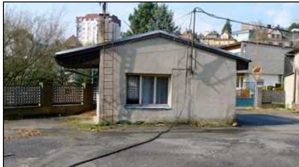
vrátnice na stpč. 726, vjezd