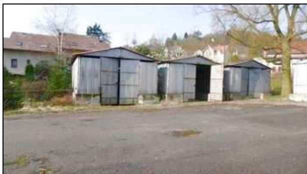
plechové garáže na pč. 663/13