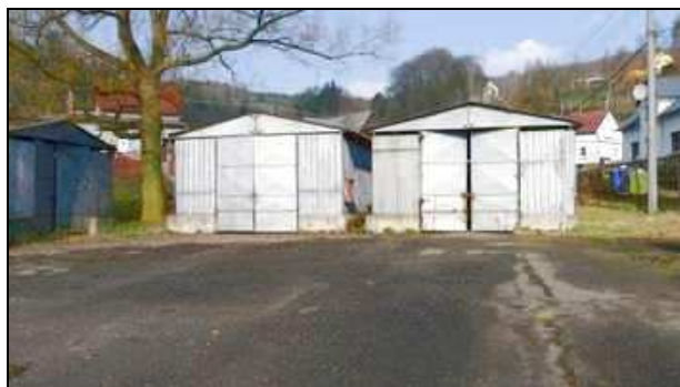
plechové garáže na pč. 806/24