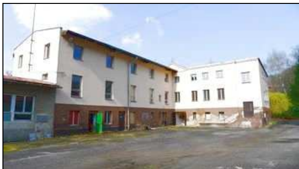
adm. budova čp. 55 - jihovýchodní pohled