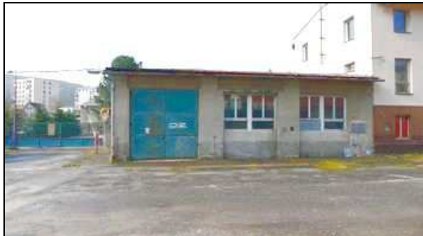
dílna na stpč. 586