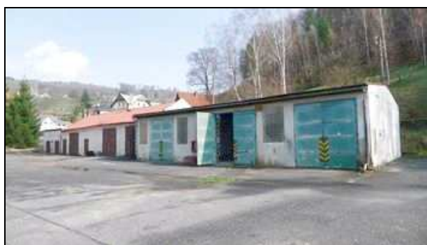
zděné garáže na stpč. 712