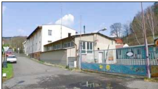
pohled z ulice Na Slatinách - jižní