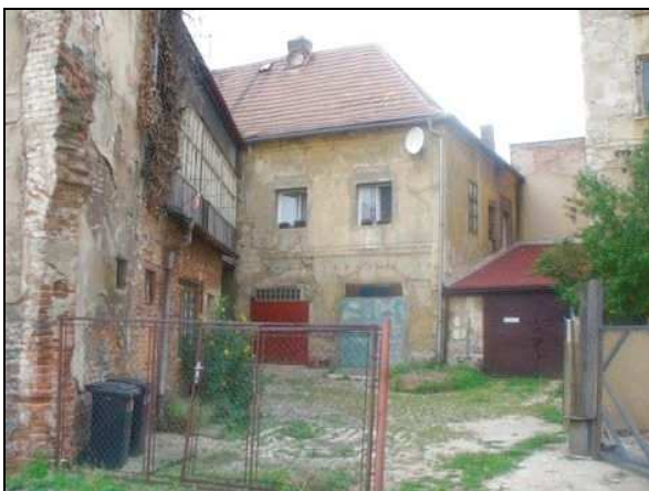
pohled jižní - dvorní část