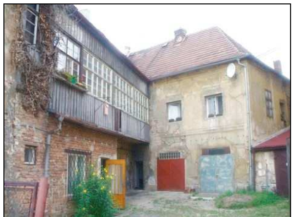
detail dvorní části s uzavřenou pavlačí