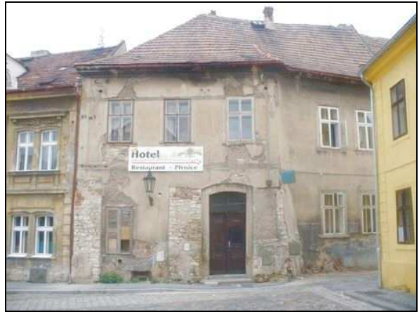
detail průčelí - pohled jihozápadní