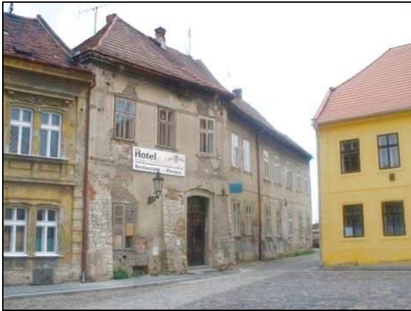
pohled západní z náměstí